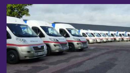
Des installations à la dimension de vos événements professionnels